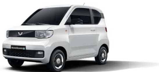
LV1. Trắng thiên hương