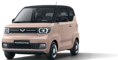
LV2. Hồng đào - nóc đen