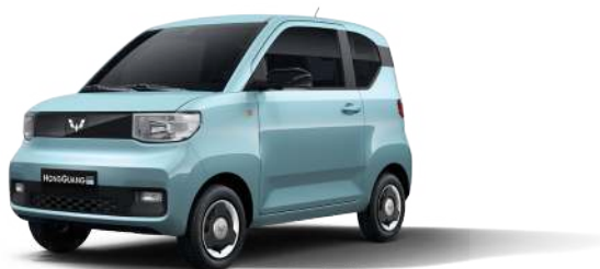
LV1. Xanh lưu ly