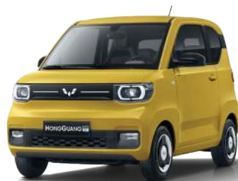
LV2. Vàng chanh