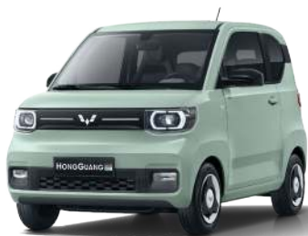
LV2. Xanh bơ