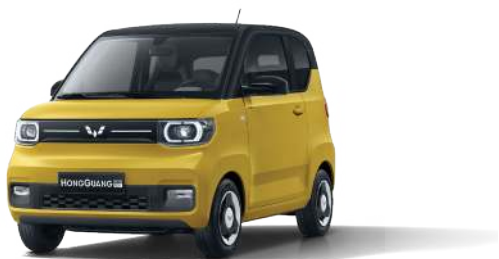
LV2. Vàng chanh - nóc đen