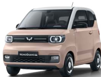
LV2. Hồng đào - nóc trắng