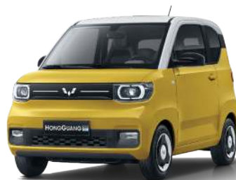
LV2. Vàng chanh - nóc trắng