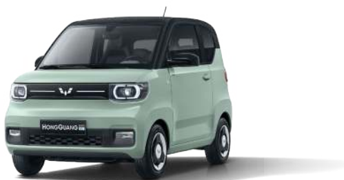
LV2. Xanh bơ - nóc đen