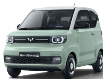
LV2. Xanh bơ - nóc trắng