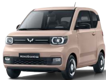
LV2. Hồng đào